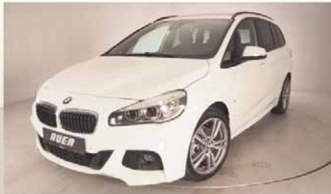
Finanzierungsbeispiel: BMW 218d Gran Tourer Modell M Sport

Ein unverbindliches Finanzierungsbeispiel der BMW Bank GmbH zzgl. Übergangskosten i. H. v. 700 EUR, Nettodarlehensbetrag: 164.900,000 Münchener alle Preise inkl. 19 % Mehrwertsteuer, Zinsfreiherkauf, Inzinsen und Druckfehler vorbehalten.