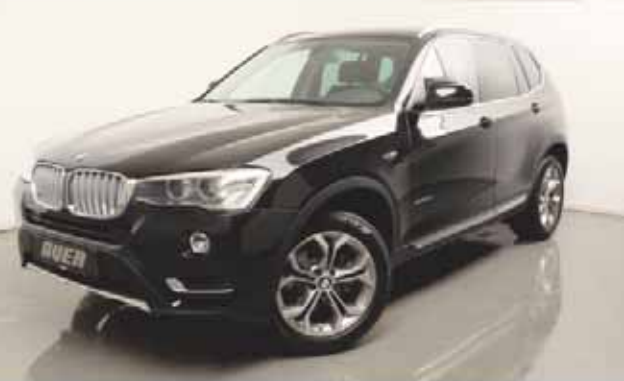
Leasingbeispiel: BMW X3 xDrive20d Modell xLine

Ein unverbindliches Finanzierungsbeispiel der BMW Bank GmbH zzgl. Übergangskosten i. H. v. 900 EUR, Nettodarlehensbetrag: 164.900,000 Münchener alle Preise inkl. 19 % Mehrwertsteuer, Zinsfreiherkauf, Inzinsen und Druckfehler vorbehalten.