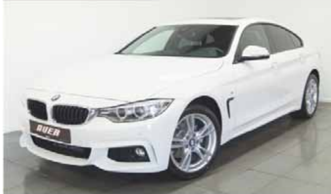
Leasingbeispiel: BMW 420d xDrive Gran Coupé Modell M Sport

Alpinweiß uni, Park Distance Control, 18" LMR Sternspeiche 400M, M-Lederlenkrad, M-Aerodynamikpaket, Automatik Getriebe Steptronic, elektrisches Glasdach, Navigationssystem Business, Geschwindigkeitsregelung mit Bremsfunktion uvm.