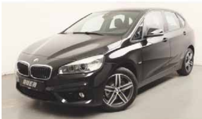
Finanzierungsbeispiel: BMW 218d Active Tourer Modell Sport Line

Ein unverbindliches Finanzierungsbeispiel der BMW Bank GmbH zzgl. Übergangskosten i. H. v. 900 EUR, Nettodarlehensbetrag: 164.900,000 Münchener alle Preise inkl. 19 % Mehrwertsteuer, Zinsfreiherkauf, Inzinsen und Druckfehler vorbehalten.