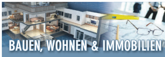
Ungerade KW*: Ludwigsburger und Oeffinger Ausgaben