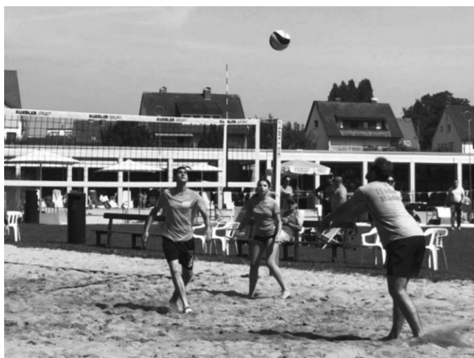
Am 21. Juni startet das beliebte Volleyballturnier im Frei- und Seebad Fischbach.

Die Startgebühr beträgt 50 Euro pro Team und wird direkt vor Ort am Anmeldestand bezahlt. Anmeldungen sind bis spätestens Samstag, 6. Juni 2026 per E-Mail an e.gherissi@friedrichshafen.de möglich. Sollte das Wetter nicht mitspielen, wird das Turnier auf Sonntag, 28. Juni 2026 verschoben.