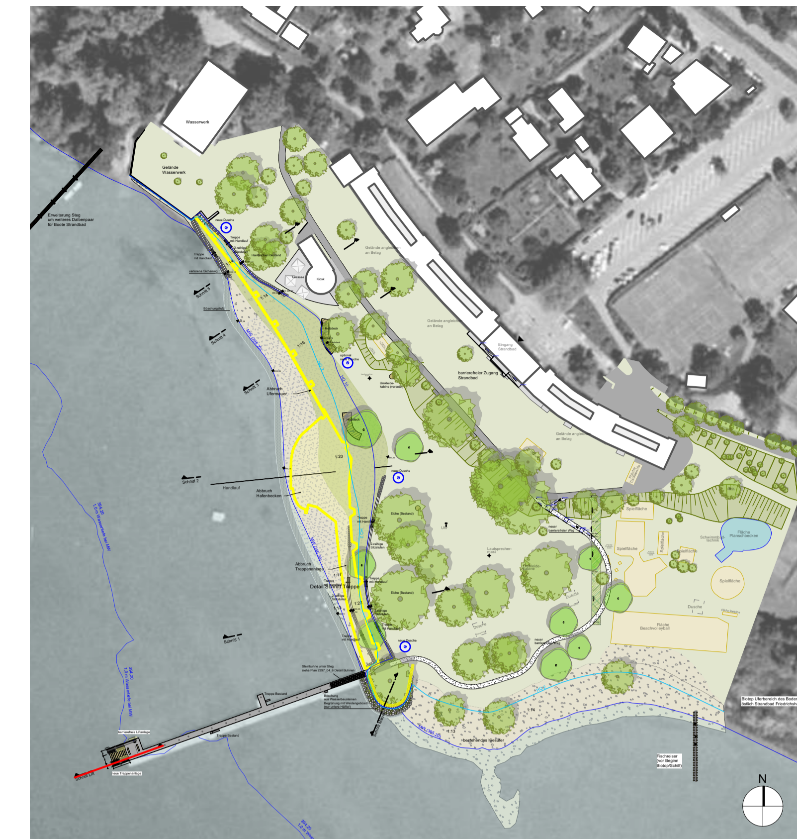
Lageplan M 1:1.500