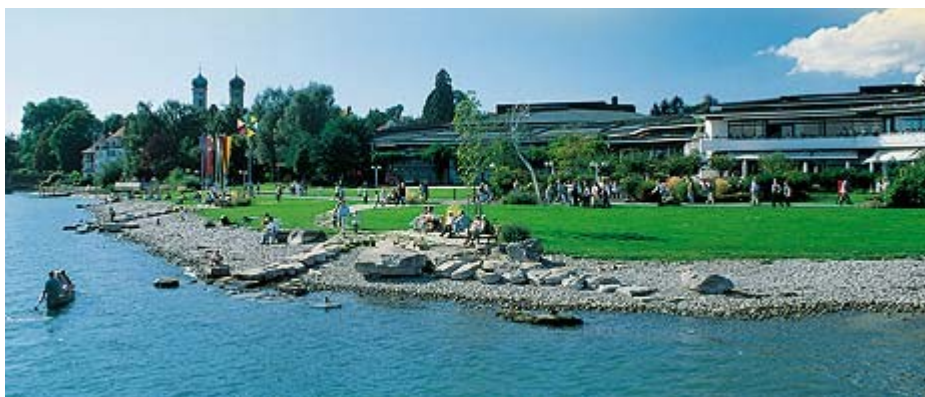
Abbildung 2: Graf Zeppelin Haus