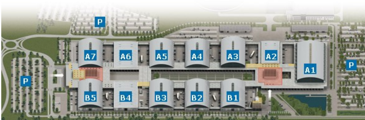
Abbildung 1: Lageplan Messe Friedrichshafen