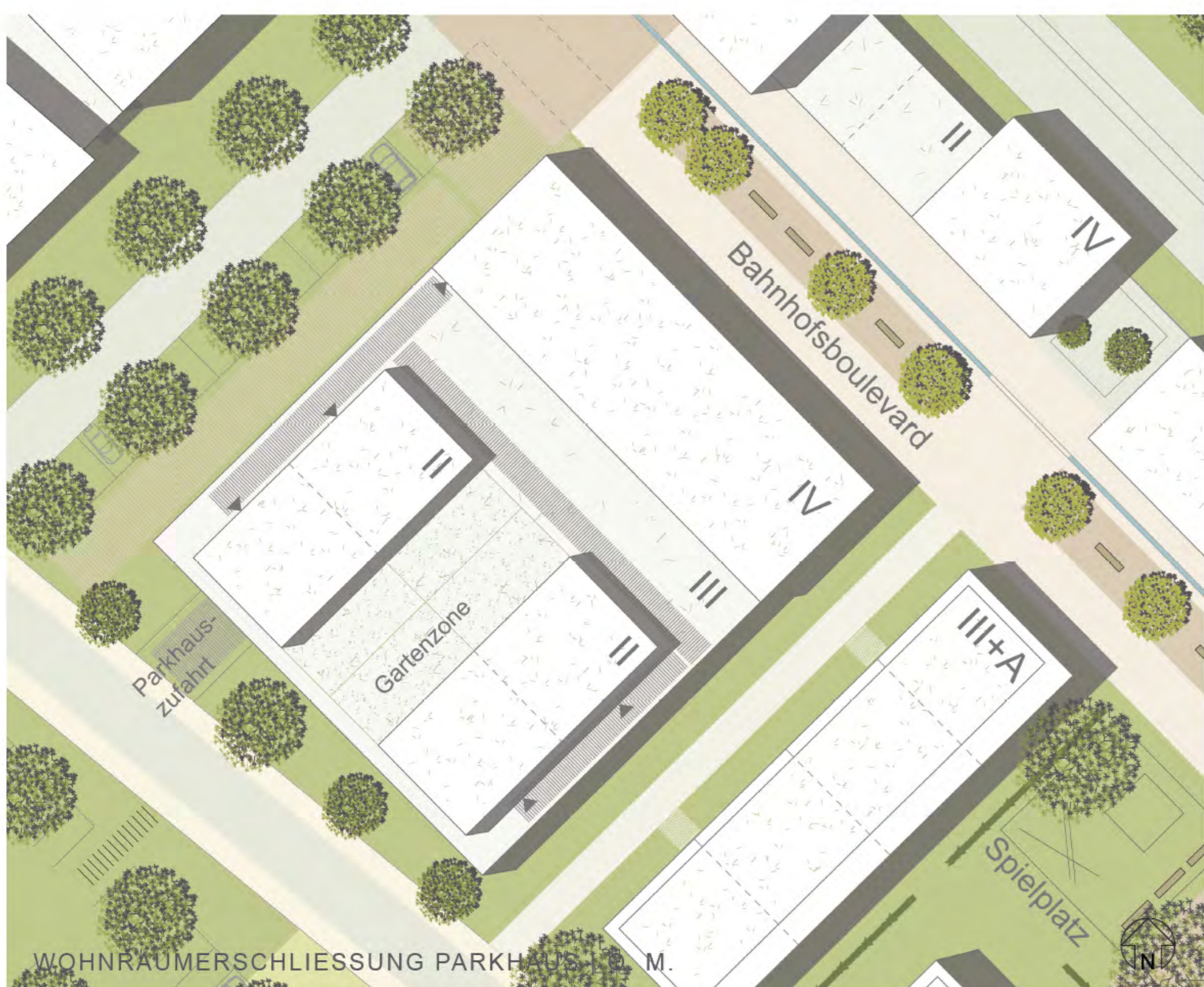
WOHNRAUMSCHLISSUNG PARKHAUS | M 1:200