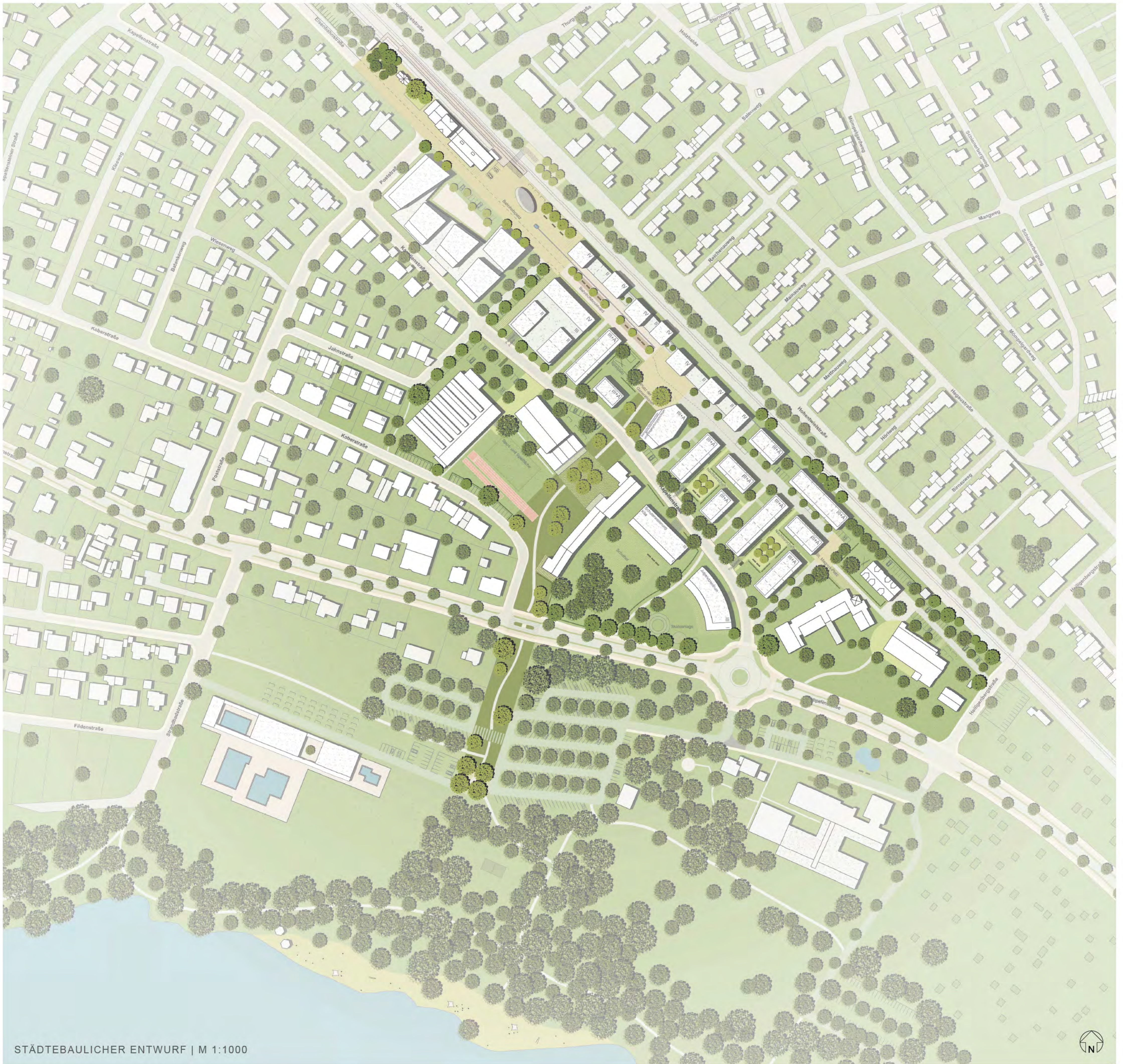
STÄDTEBAULICHER ENTWURF | M 1:1000