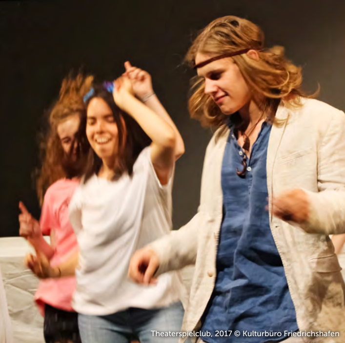
Theaterspielclub, 2017