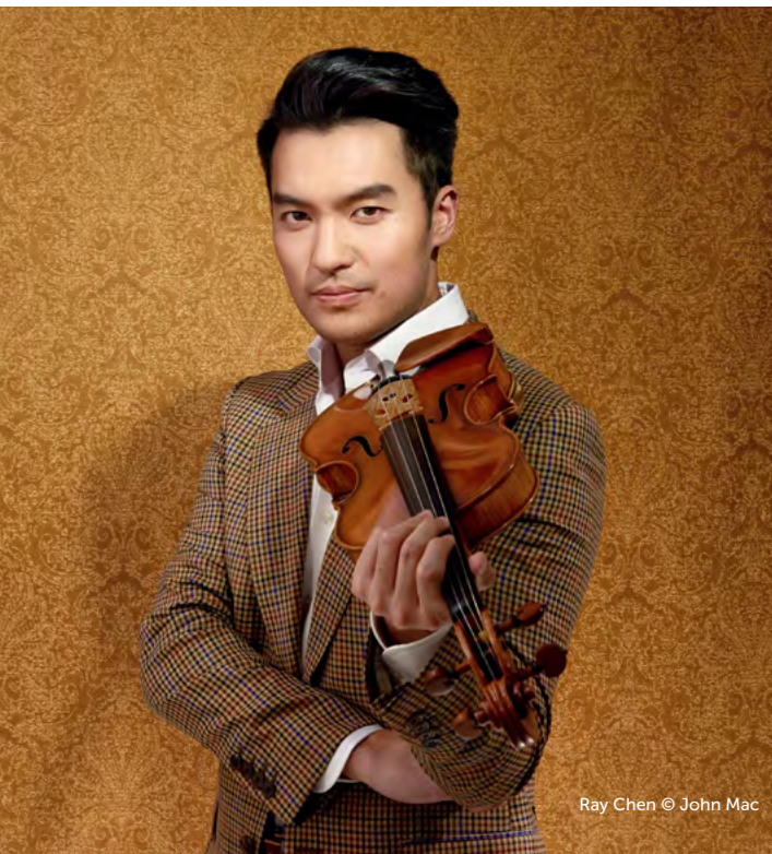
Ray Chen

Dieses Angebot ist aus unserem Genre „Konzerte & Musiktheater“. Wir empfehlen die Vorführung interessierten Jugendlichen ab 12 Jahren in Begleitung Erwachsener.