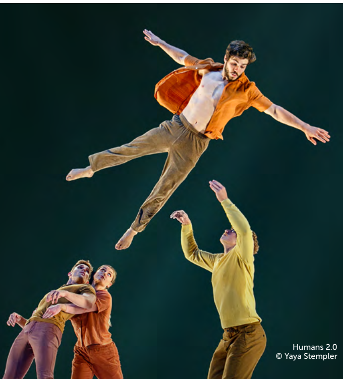
Humans 2.0