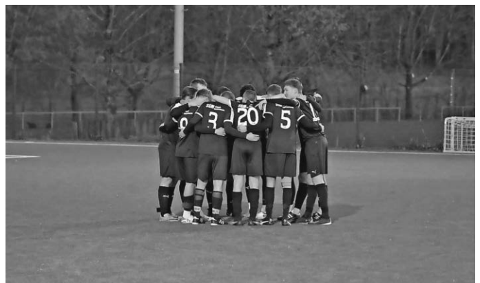
Mit einer geschlossenen Mannschaftsleistung drehte die SGM I im Heimspiel gegen den TSV Neukirch einen 0:2-Rückstand in ein 4:2.